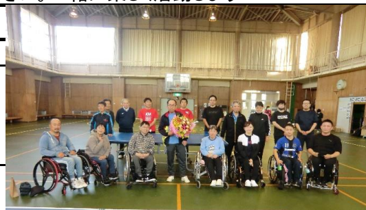
① 2021.11.7 第1回 エール杯