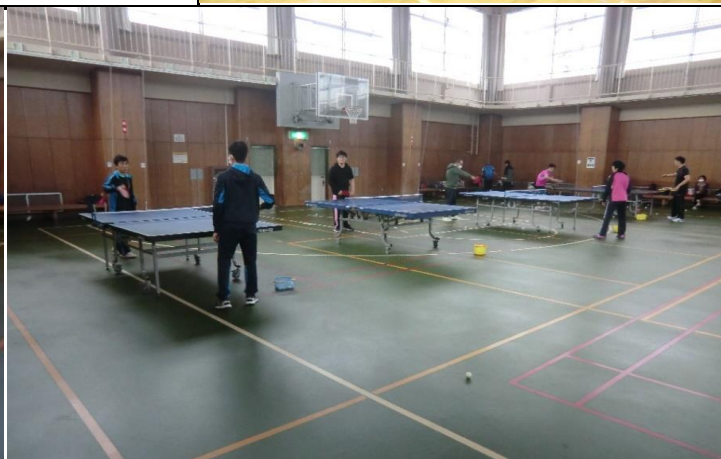
④ 2020/10/17 練習風景