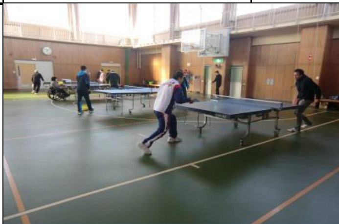
③ 2020/1/16 練習風景