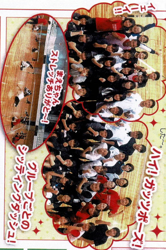
みんなガッツポーズ! ストリッチありがとう!!

石川あいあい『親善交流大会』が10/15日(月)に開催されました! 会員17名、会員のお友達など一般の方6名、大学生12名、中学生12名の総勢47名のプレイヤーが集まりました。まずはせんせーより注意点などの説明があり、トリーナー・まえちゃんによるストリッチから始まりました。ゲームではラリーの応酬も多く、強打やブロックもたくさん見ることができ、どの試合もとても盛り上がりました!! たくさんの差し入れありがとうございました! そして皆さん、おつかれさまでした~。